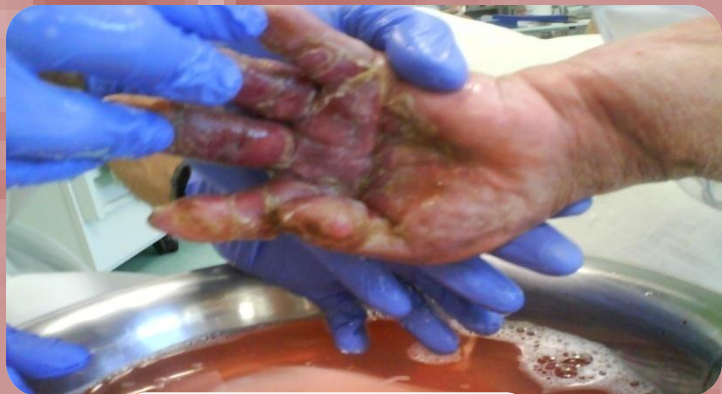
Limpeza da pele