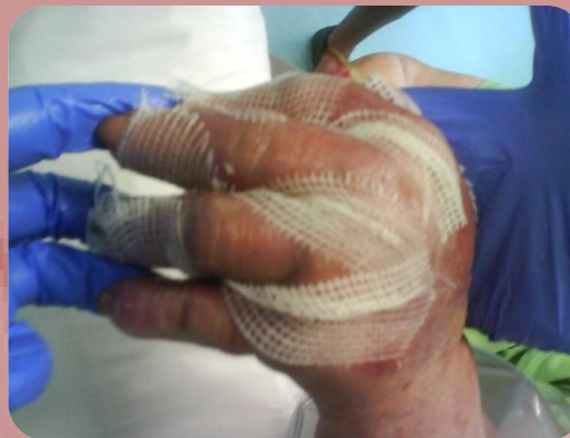
Aplicação de hidrogel